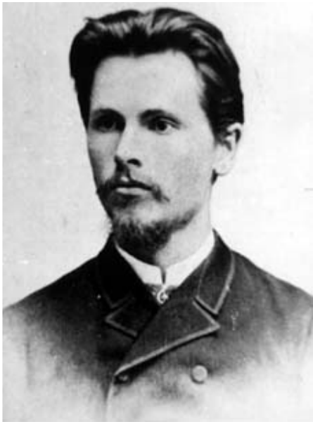
VINCAS KUDIRKA APIE PARDAVINYČIAS

1858 – ujų metųgruodžio 31 – ają dieną gimė Lietuvių rašytojas, Lietuvos himno autorius, Vincas Kudirka. Šis žmogus gerai žinomas tarp Lietuvių, tačiau argi visi žino, kad Kudirka buvo aršus antisemitas ir kovotojas prieš žydiją?