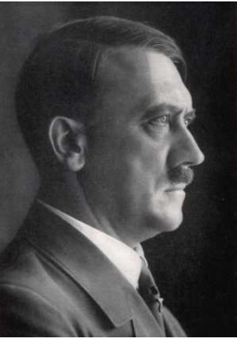
ADOLFAS HITLERIS, MANO KOVA

Ir tada nutiko kažkas, kas jo gyvenime savotiškai buvo taip pat lemiamą, kaip jo surastas Adolfo Hitlerio mokymas Mein Kampf prieš aštuonis metus San Diege. Vėl, tai buvo kaip vedanti ranka, siekianti jo iš praeities