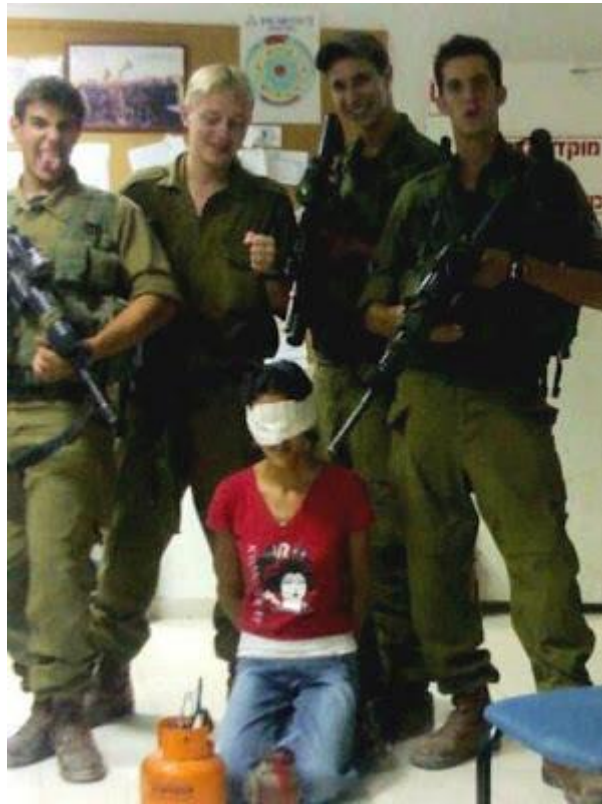
Her leker jødene den morsomme leken "Mens vi venter på Amnesty International."