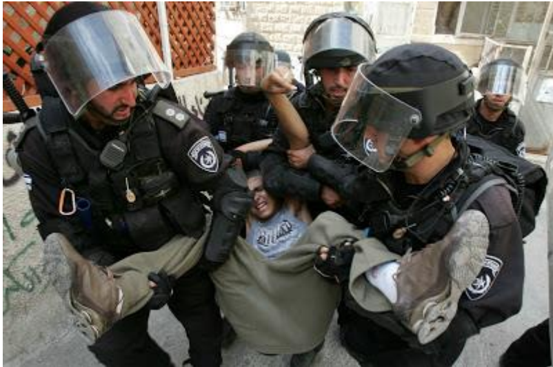
6 jødiske leger hjelper en palestinsk epileptiker. Det er ingen måte på hvor hjelpsomme jødene er.