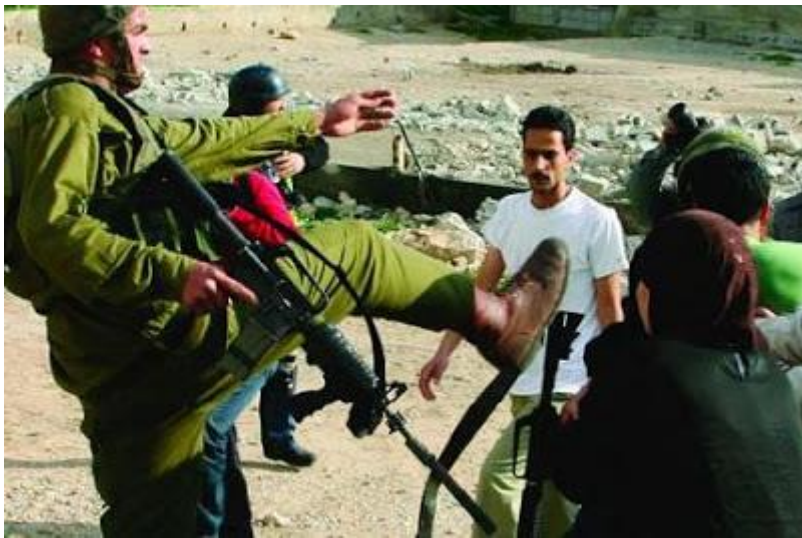
En palestinsk kone lurer på hva slags skostørrelse den jødiske soldaten har. Soldaten er hyggelig nok til å løfte på foten slik at hun kan lese størrelsen som står skrevet under skoen.