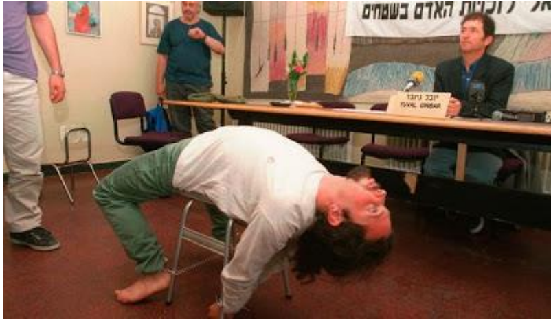
"Ligge på ryggen" er også alltid en slager.