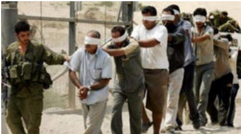
Her leker de den populære leken "Blindbukk" med palestinerne.