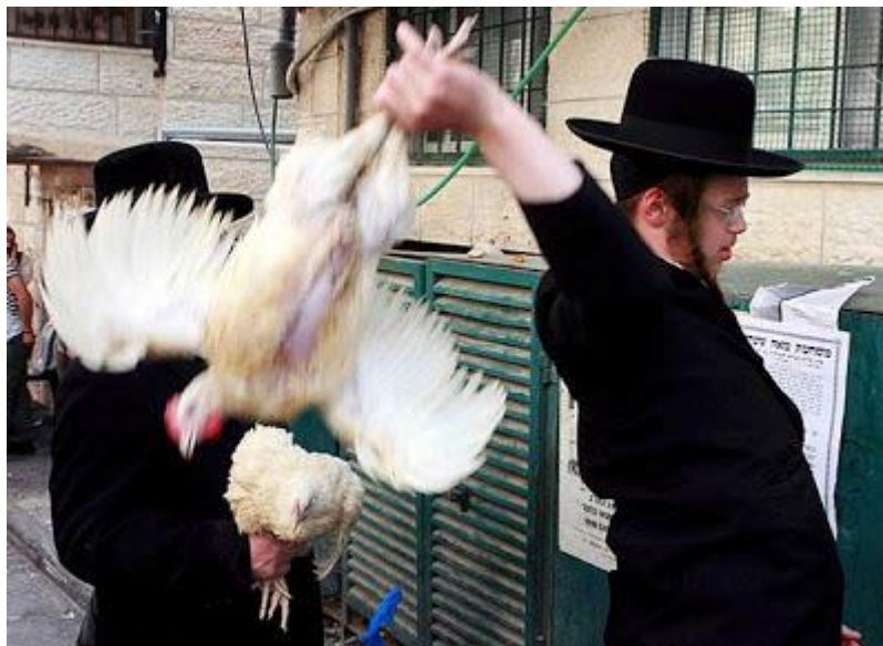
Minst en gang om året er det også bra å vifte med en høne.