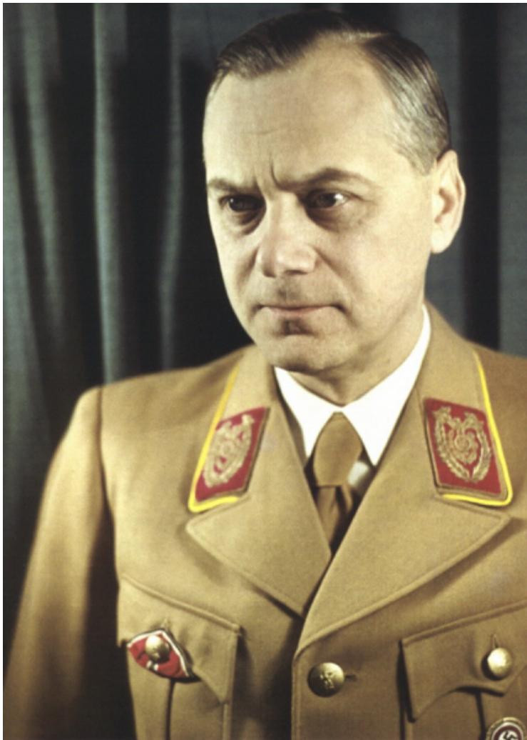
Alfredo Rozenbergas „Dvidešimtojo amžiaus Mito“ recenzija

Trumpai aptarkime genialųjį Alfredo Rozenbergas veikalą „XX Amžiaus Mitas“. Knyga susideda iš trijų tomų: (1) Vertybių konfliktas, (2) Germaniško meno natūra, (3) Ateities valstybė. Tai yra vienas iš stambiausių, sudėtingiausių, bet ir genialiausių Nacionalsocializmo ideologijos veikalų. Alfredas Rozenbergas - didis mąstytojas, ideologas, vokiečių, europietis ir arijų rasės atstovas. Dabar nuosekliai ir trumpai aptarsime jo didįjį veikalą (Dvidešimtojo Amžiaus Mitą).